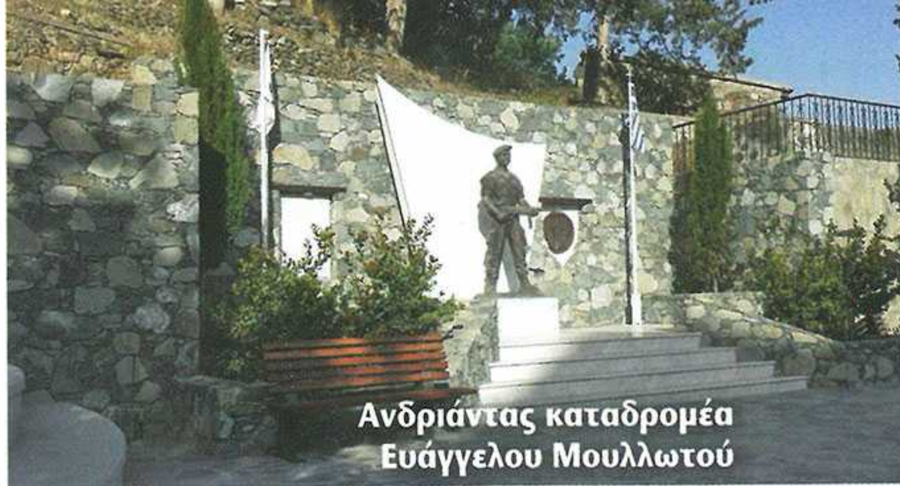
Ανδριάντας καταδρομέα Ευάγγελου Μουλλωτού

Οι κάτοικοι του Αγίου Κωνσταντίνου συνέβαλαν με τη σειρά τους στους αγώνες της πατρίδας για ελευθερία. Σημαντική ήταν η συμβολή τους στον αγώνα της ΕΟΚΑ κατά των Άγγλων αποικιοκρατών αλλά και σε άλλους αγώνες της πατρίδας. Στην κεντρική πλατεία του χωριού, «Ευάγγελος Μουλλωτός», υψώνεται ο ανδριάντας του καταδρομέα Ευάγγελου Μουλλωτού, ο οποίος έπεσε μαχόμενος κατά την τουρκική εισβολή. Στην πλατεία «Φουντάνα», υπάρχει η προτομή του Γιαννάκη Χριστοφόρου, ο οποίος υπήρξε αντάρτης της ΕΟΚΑ με πλούσια δράση κατά τη διάρκεια του εθνικοαπελευθερωτικού αγώνα 1955-59. Όταν βρεθείτε στο χωριό, επισκεφτείτε επίσης τα δύο κρησφύγετα της ΕΟΚΑ, τα οποία βρίσκονται σε μια